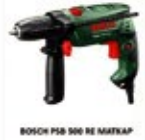
BOSCH PSB 500 RE MATKAP