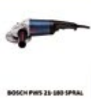
BOSCH PWS 21-180 SPİRAL