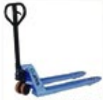
JETCO 2500 KILTRANSPALLET