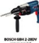
BOSCH GBH 2-28DV KIRICI DELİÇİ