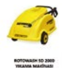
KOTENGEN ED 2800 YIKAMA MAKİNASI