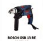
BOSCH GSB 13 RE MATKAP