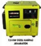
7,5 KW DIESEL KAPALI JENERATÖR