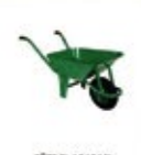
FÜZE EL ARABASI