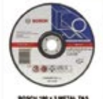
BOSCH 18 x 3 METAL TAŞ