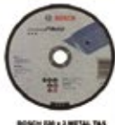
BOSCH 28 x 3 METAL TAŞ