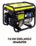
7,5 KW DIESEL AÇIK JENERATÖR